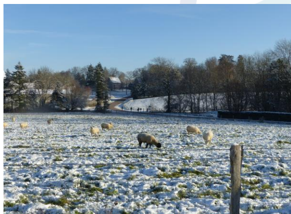
Brebis allaitantes au pâturage / L. de La Hays Saint Hilaire, 12/2022