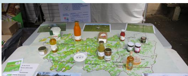
Jeu de carte sur l'agriculture et l'alimentation locales – Fête de la Biodiversité d'Épinal / Pierre Guillemin, juin 2022,

Cette interdisciplinarité est structurée dans chaque volet de recherche. Elle permettra d'organiser un travail comparatif des différents territoires étudiés, via des grilles d'analyse partagées construites en mobilisant les différentes disciplines.