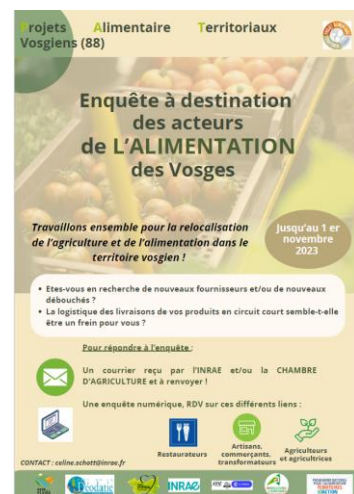
Affiche pour une enquête acteurs-chercheurs sur les flux agri-alimentaires dans les Vosges/ InterPAT 88

Bio en Grand Est, Cellule Manger Demain (Wallonie), Chambre Régionale d'Agriculture Grand Est, Réseau PARTAAGE , porteurs de Projets Alimentaires Territoriaux (France) et de Conseils de Politiques Alimentaires (Belgique et Luxembourg)